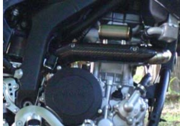
別売りカーボンヒートガードHG-1