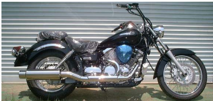
STEP1: ノーマルサイレンサーの取り外し